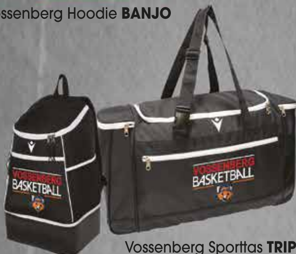
Vossenberg Sporttas TRIP