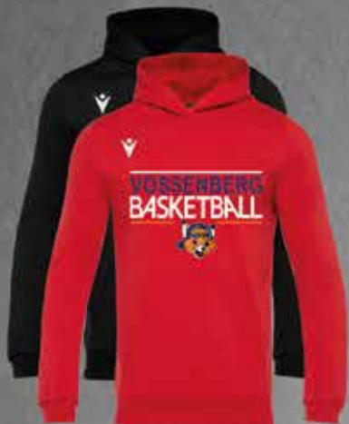
Vossenberg Hoodie BANJO