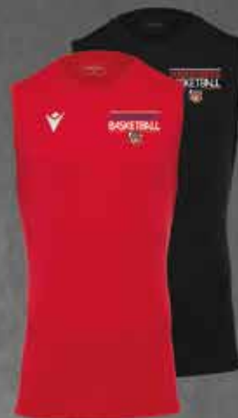
Vossenberg Top KESIL