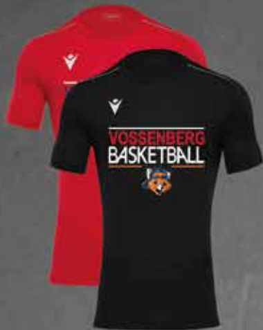
Vossenberg Shooter RIGEL