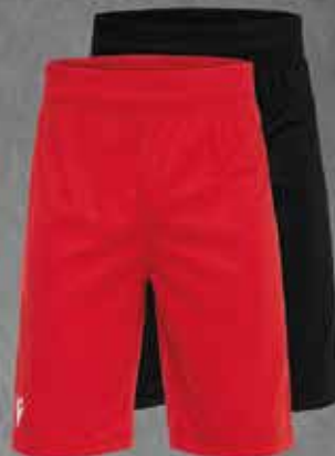
Vossenberg Short CURIUM